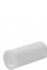
#5017 テフロンスリーブ