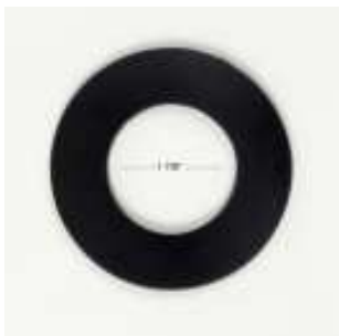
小径缶ガスケットセット (#5132 / #5125 / #5128)