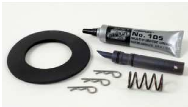
#5165EX メンテナンスキット