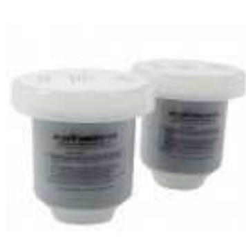
#6363 活性炭カートリッジ(2 個入)