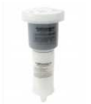
#6163 コンビネーションフィルタ